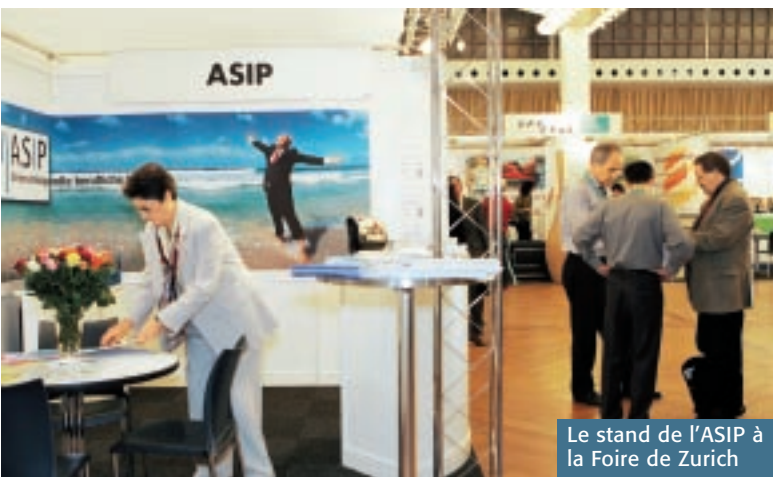
Le stand de l'ASIP à la Foire de Zurich