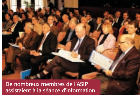
De nombreux membres de l'ASIP assistaient à la séance d'information