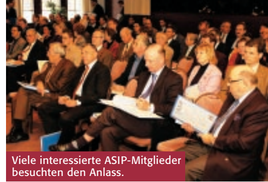
Viele interessierte ASIP-Mitglieder besuchten den Anlass.