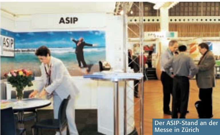
Der ASIP-Stand an der Messe in Zürich